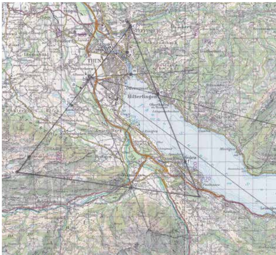
Abb. 4: Dreieck am Thunersee.