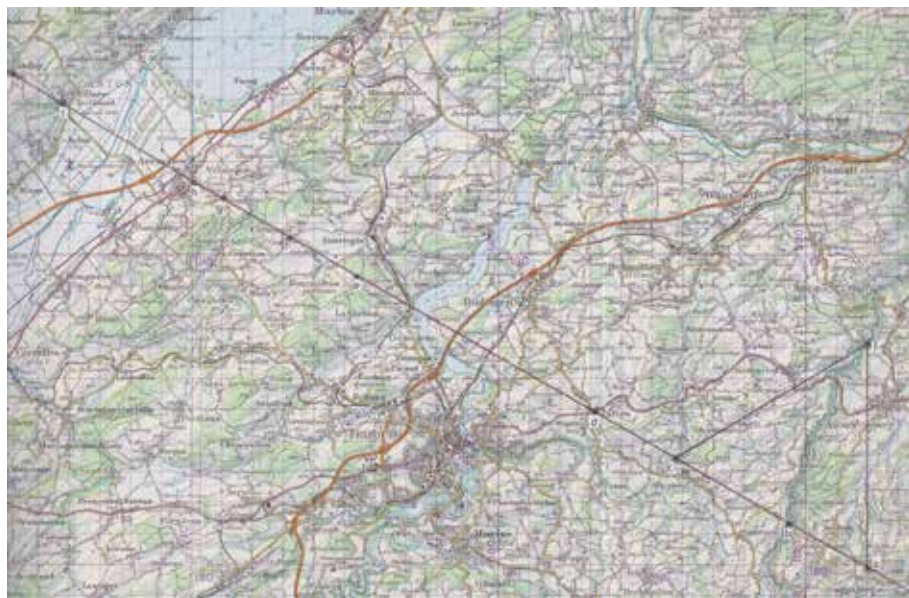
Abb. 2: Kultlinie vom Guggershorn nach Aventicum mit stützendem Dreieck.