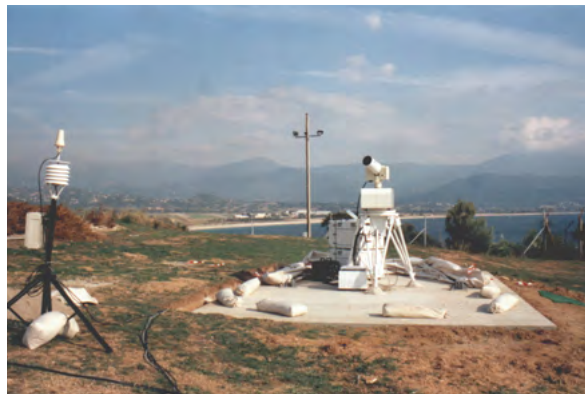
Abb. 3: E2-SD: links: kurz vor der Auslieferung in der Leica PMU in Unterentfelden, rechts: implementiert im Gesamtsystem FTLRS bei einer Messkampagne auf Kreta.